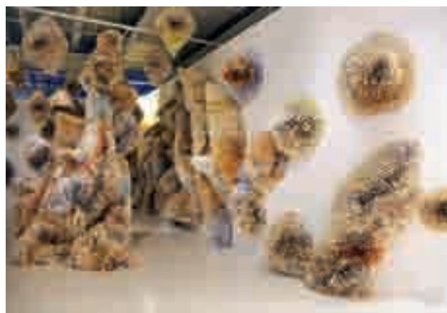
《表现形式6》作者/Samuella Green(美国) 作品从中国收集900本旧书及废报纸来做成穹顶,将直线空间转换为有机超凡脱俗的环境。