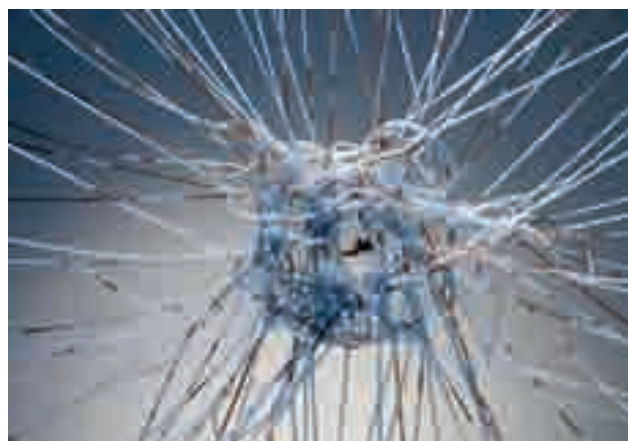
《污染的尽头》作者/Thijs Biersteker(荷兰) 烟头对自然界中的影响通过水泵进入周围水中,当观众靠近安装时,液体流动速度会减慢。作品揭示了小而有害的废物对于自然界的影响,鼓励人们采取行动。