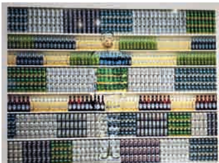
《城市迷彩》作者/刘勃麟(中国) 人类社会的快速发展掩盖了人类本身,人变成自己所创造的世界家园的附属品,成了“隐形人”。作品立足于探讨人类与社会发展的关系,思考城市环境如何影响人们的生活。