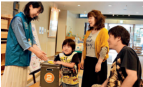
“摸到了啥？”——志愿者正在指导小朋友亲身体验