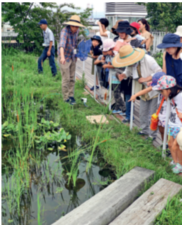
“你看,那是啥?”——参观者生物侦探活动中

成立于2002年4月、位于日本古都—京都的京都市立环境保护促进中心(又名京都生态中心,以下简称中心),是日本知名环境教育机构,该中心是为纪念联合国气候变化框架公约第三届缔约方会议(COP3)《京都议定书》的签署而建。