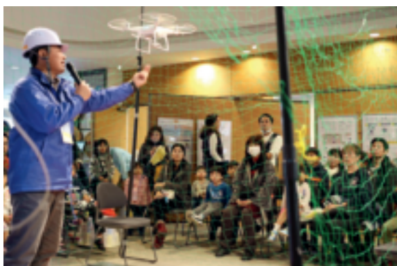
“灾害发生时该咋办？”——专业人员讲解灾害预防知识