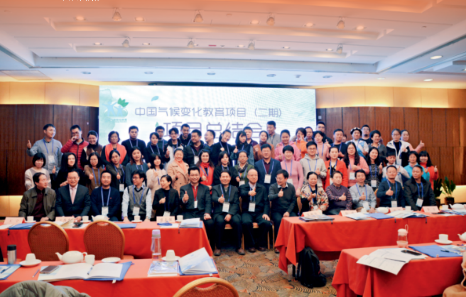
2018年12月21日,西安, CANGO中国气候变化教育项目总结交流会

非政府组织 (NGOs) 在气候治理领导体系的构建和推进全球气候治理中发挥越来越重要的作用。