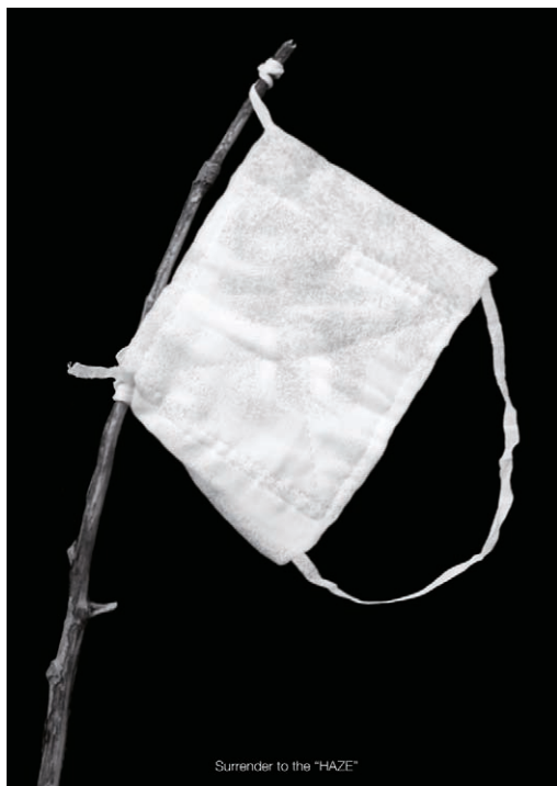
▲《举白旗》当我们戴上口罩的时候，相当于投降了。