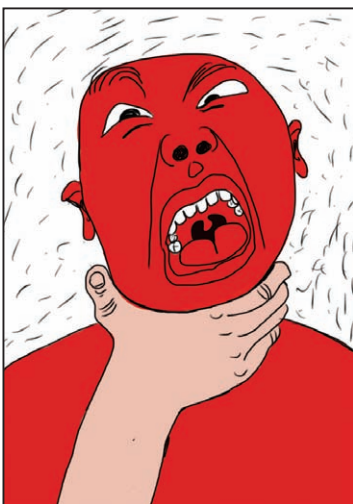
▲《被扼住咽喉》NOZUONODIE，都是被害。

于是，一呼百应。 这是， 一次中国设计师的公益动员， 一次专业志愿者的文艺启蒙， 一次关于公民对问题如何表达的对话。 来，让我们同憋气共命运！ 来，请负责传播的媒体接棒， 把声音传递给相关政府和企业。 （牛一力）「拒绝雾霾全民创意行动周」北京地区发起人，社会企业公益传播发起人（世）