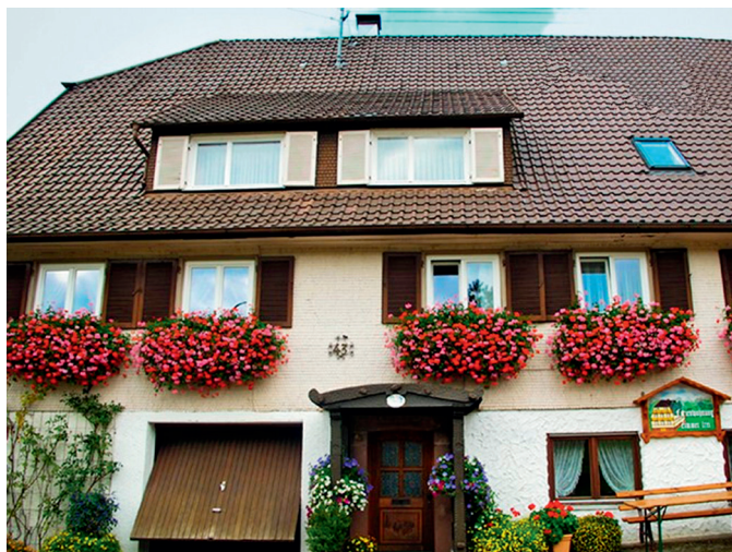
窗台上布满鲜花的德国民居