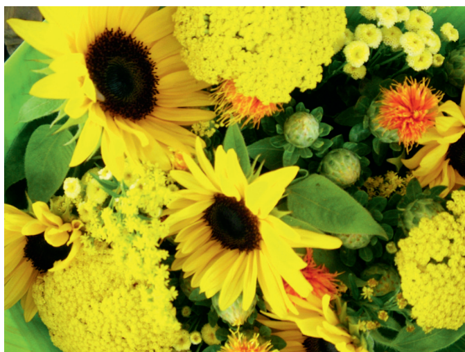
高速公路服务区售卖的小向日葵