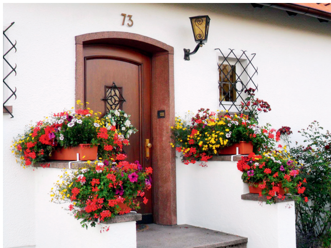
德国人家门前的花