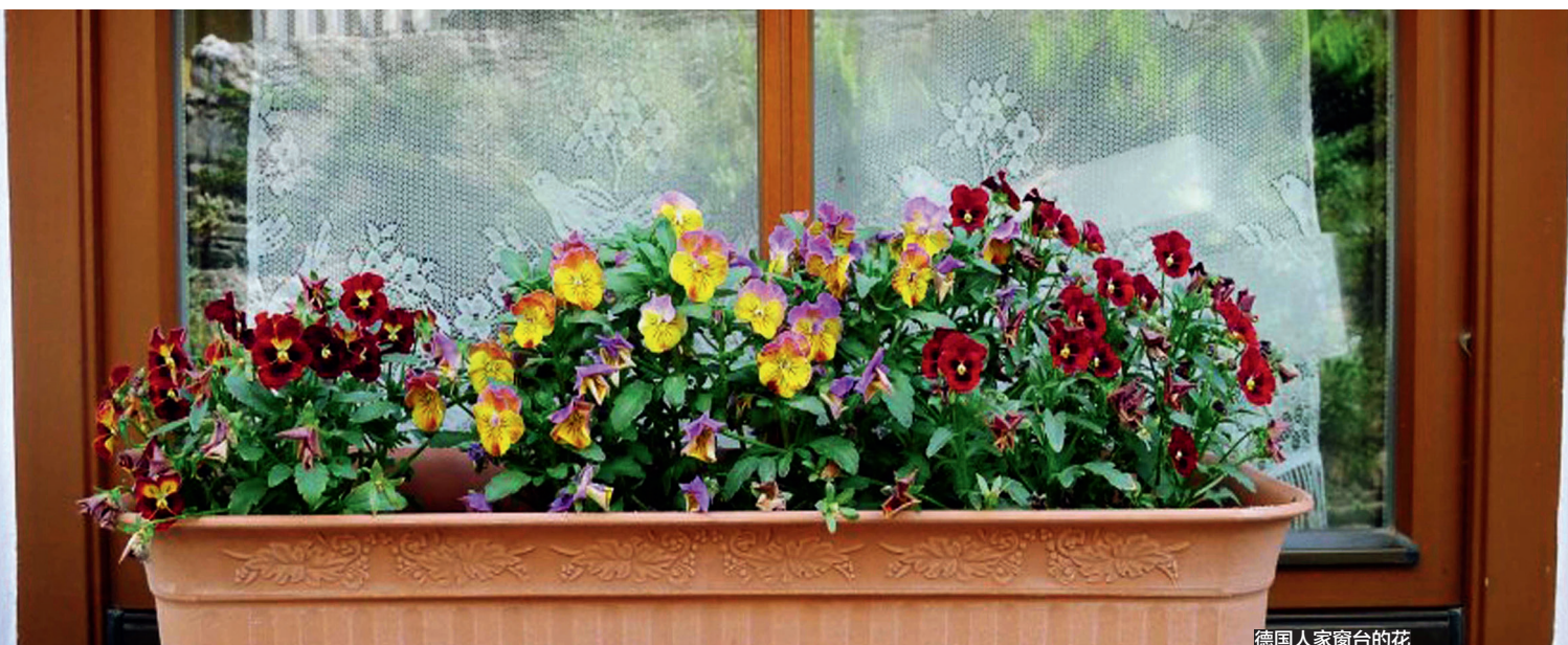
德国人家窗台的花