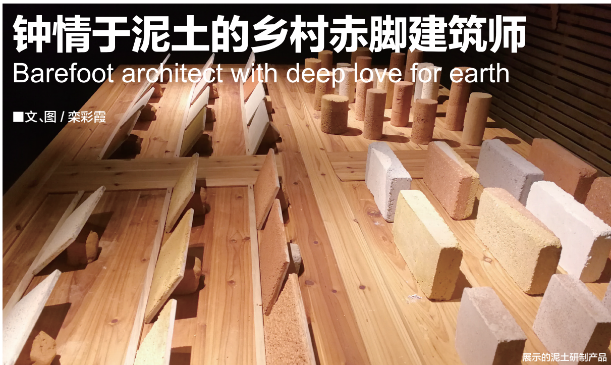
展示的泥土研制产品

中国乡村传统中有三件大事：建房子、娶媳妇和生娃娃，而房子是后两件大事的前提和舞台。房子曾是一辈子的事，古人云：道旁结屋三年难成，它承载对于美好生活的期许，也搭载着国人的许多乡愁。