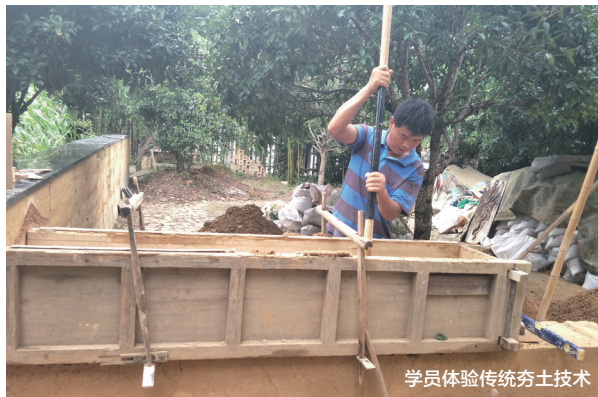
学员体验传统夯土技术

整个院落有血、有肉、有故事,有纵深又紧凑,顺势而为、就地取材,适合工作又宜居,像一幅舒缓的田园画卷。泥土建筑用本质、传统的夯土技术,节能环保、冬暖夏凉又造价低廉。三到四个月时间,6万至7