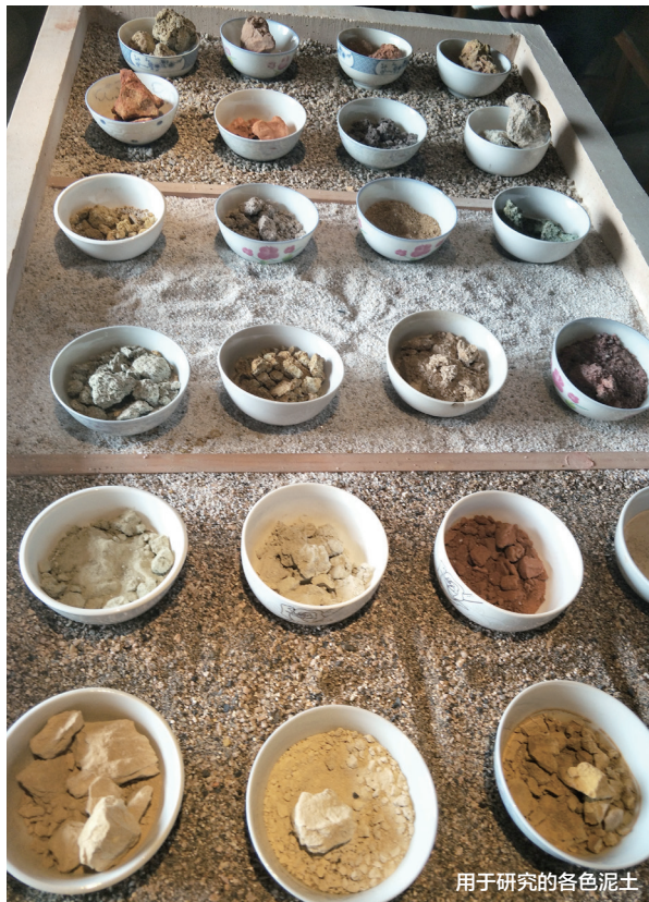
用于研究的各色泥土