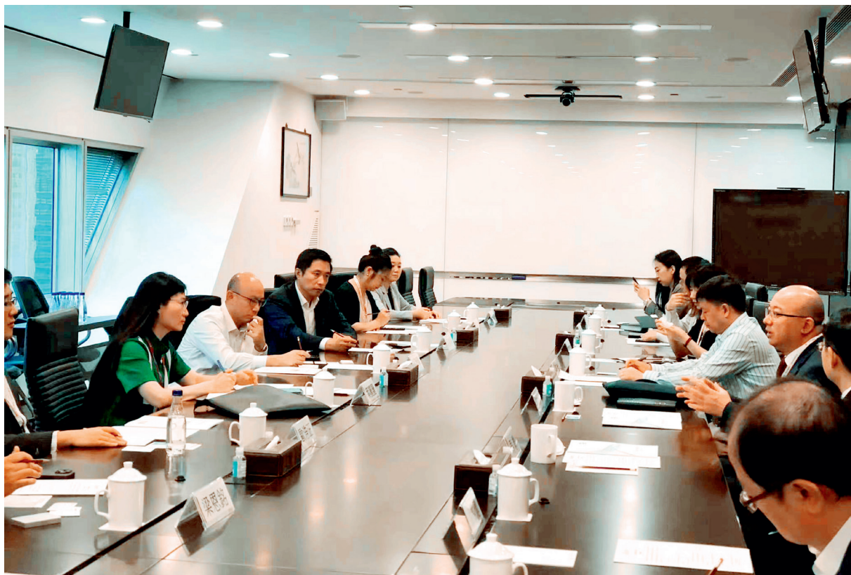
生态环境部宣教中心与香港绿色金融协会座谈交流