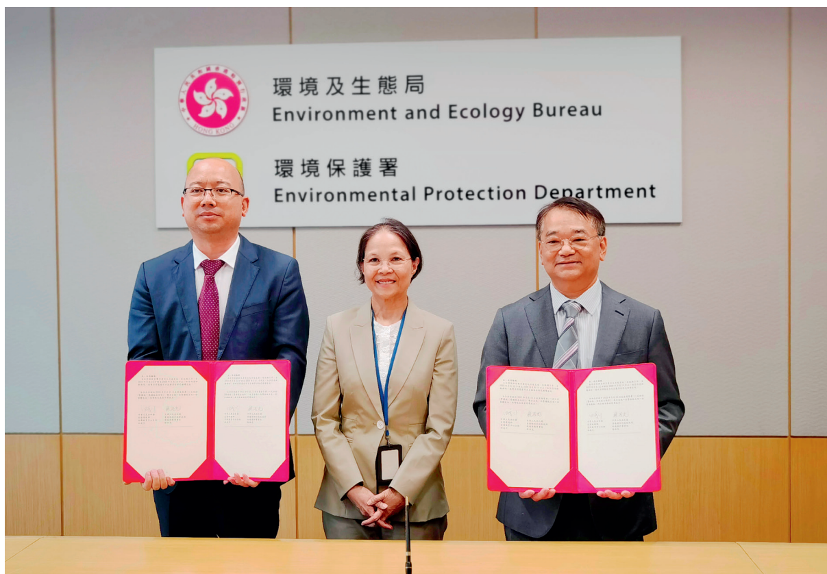
生态环境部宣教中心与香港环境保护署签署合作安排

The Center for Environmental Education and Communications of the Ministry of Ecology and Environment visited Hong Kong to carry out cooperation and exchanges on environmental education and signed cooperation arrangements with the Environmental Protection Department of Hong Kong