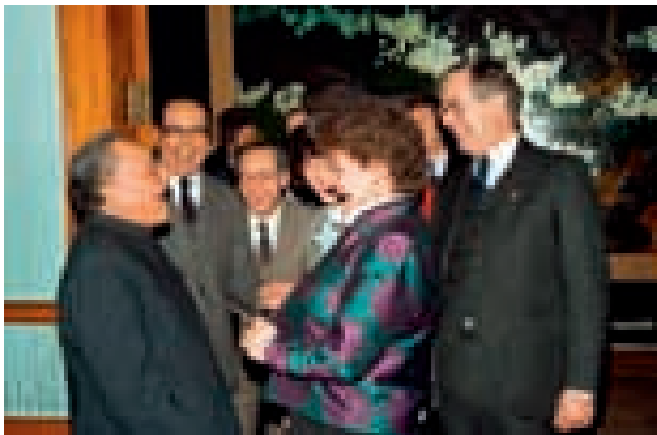
1988年,布伦特兰与邓小平北京会面

流三个部分组成。她阐述了挪威同亚洲建立长期经贸合作的巨大潜力和必要性,并肯定了亚洲在联合国事务、维护世界和平以及解决环境、人口等问题上不可替代的重要作用。在该构想的推动下,挪威与中国等亚洲国家的关系有了长足进展。