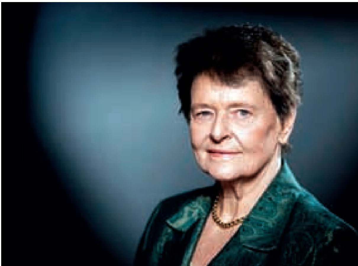
格罗·哈莱姆·布伦特兰

2020年4月，格罗·哈莱姆·布伦特兰发表《新冠疫情揭示了我们共同的人性和弱点》一文，呼吁世界各国加强国际合作，共同坚持可持续发展理念以战胜新冠肺炎疫情。许多人因此想起了这位在17年前曾带领世界卫生组织（WHO）应对“非典”疫情考验的前WHO总干事。与此同时，也想起布伦特兰这个为世界各国熟知的名字以及她的多重身份：挪威首相、政治家、外交家、环保主义者、女性平权主义者。