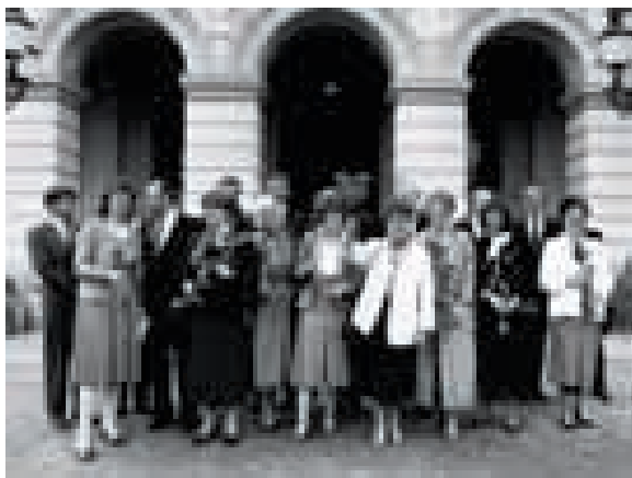
1986年,布伦特兰与其任命的“女性内阁”合影

中,布伦特兰亲自带领委员会成员到各国举办研讨会,了解各国情况和不同利益相关方的特别关切和意见分歧。一些参会者后来回忆,布伦特兰认真细致、真诚坦率,从不错过倾听任何一个人的发言。最终,她领导的环境与发展委员会在深入研究和相互理解的基础上达成共识并形成了结论和建议。布伦特兰对人类走可持续发展之路具有坚定的信念,“你要相信自己的直觉,要能够坚持你深信不疑的东西,让别人能感受到你的热情和说服力。”她多次表示,通过坚定的信念和不断沟通,各国最终一定能够找出一条合作之路。《布伦特兰报告》提出举办“全球可持续发展峰会”的倡议得到采纳,1989年12月联合国大会通过44/228号决议,决定召开环境与发展全球首脑会议。为准备这次会议,联合国于1990年开始组织起草会议文件,凝练可持续发展的核心理念和目标,并着手制定优先领域和行动计划。1990-1992年,国际社会召开了多次全球性会议,各国政府集智聚力,探讨解决世界面临的紧迫问题的有效途径,朝着可持续发展成为全球发展共识的方向不断迈进。