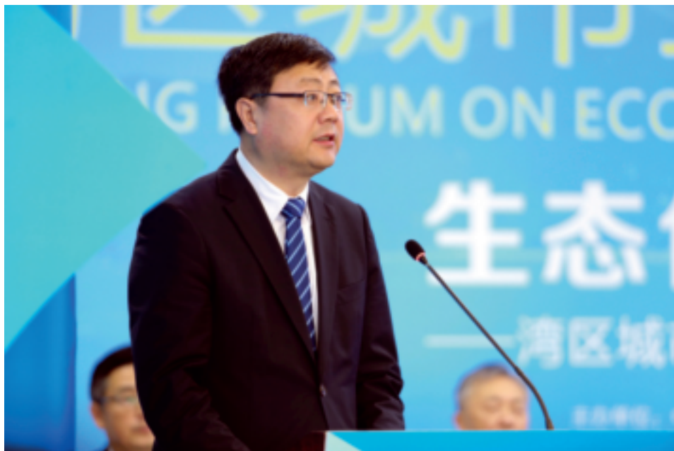
环境保护部部长陈吉宁 做主旨演讲

4月16日至17日,湾区城市生态文明大鹏策会在深圳举行。会议针对新形势下湾区城市生态文明建设的热点难点问题进行了交流研讨,通过了《湾区城市生态文明·鹏城倡议》,发布了《我国重点湾区生态文明建设绿皮书》。据悉,这也是国内首次专门针对湾区城市生态文明建设热点难点问题,进行的交流、研讨和献计、问策的会议。