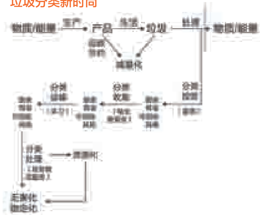
居民参与垃圾分类范围变化图