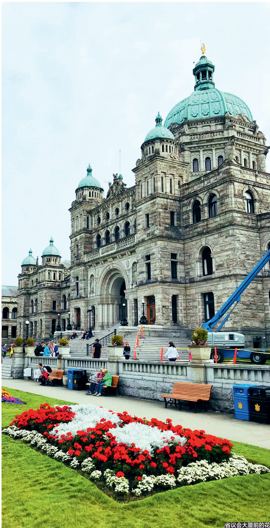
省议会大厦前的花

温哥华岛上最大的城市和海港。维多利亚气候温和,属温带海洋性气候,年平均降雨量686毫米。1月份气温4-5℃,一年霜冻期只有20天。市内秀美宁静,繁花似锦,一年四季绿草如茵,城市把街道绿化成花园,更不用说居民的房前屋后了,所以维多利亚素有“花园城市”的美称,这么美丽的城市自然成为一个旅游城市,毕竟爱美之心人皆有之。