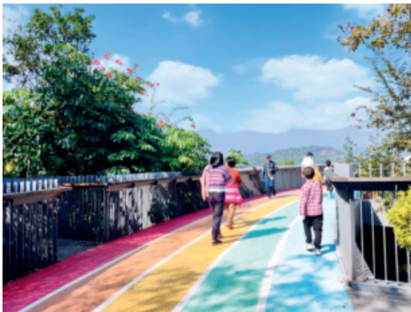
福道为市民提供亲近自然的生态空间