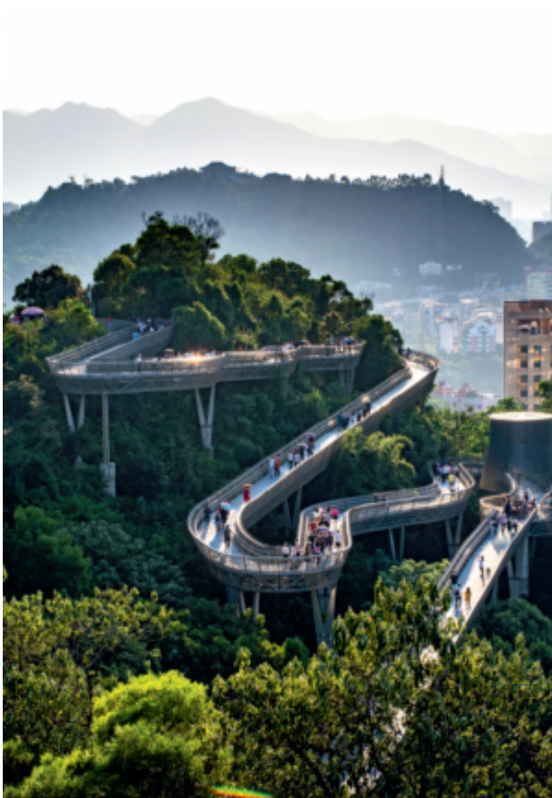
漫步福道,享绿意生活