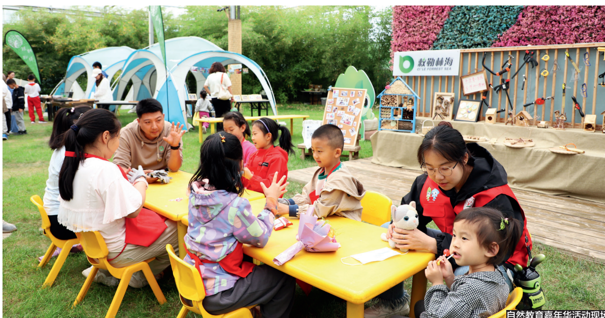
自然教育嘉年华活动现场