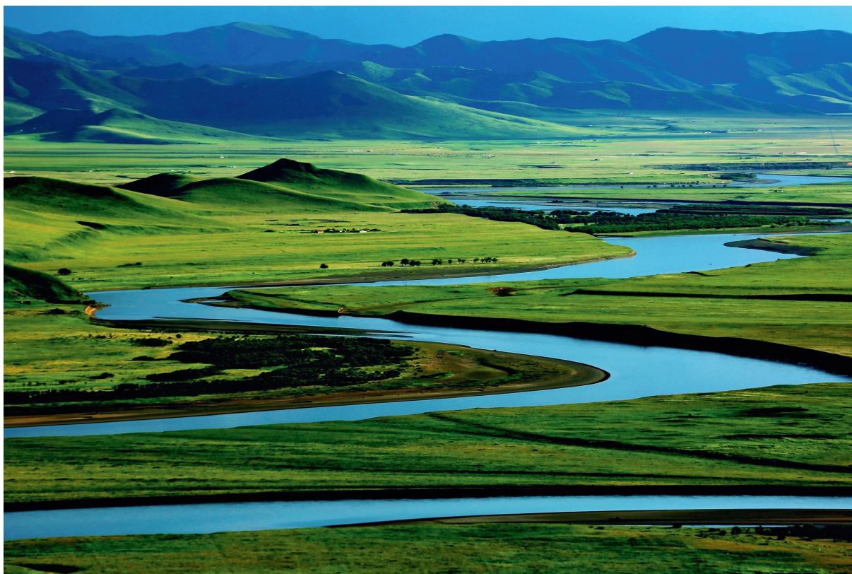
黄河九道湾

切实加强祁连山生态环境保护常态化监管,着力解决突出生态环境问题,全省生态环境质量持续巩固改善,生态环境保护工作取得积极成效,人民群众对良好生态环境的获得感、幸福感和安全感不断增强。在全国生态环境保护大会召开后,甘肃省委第一时间以加强生态文明建设为主题召开省委十四届三次全会,印发实施《中共甘肃省委关于进一步加强生态文明建设的决定》,对推进生态文明建设、筑牢生态安全屏障作出安排部署。