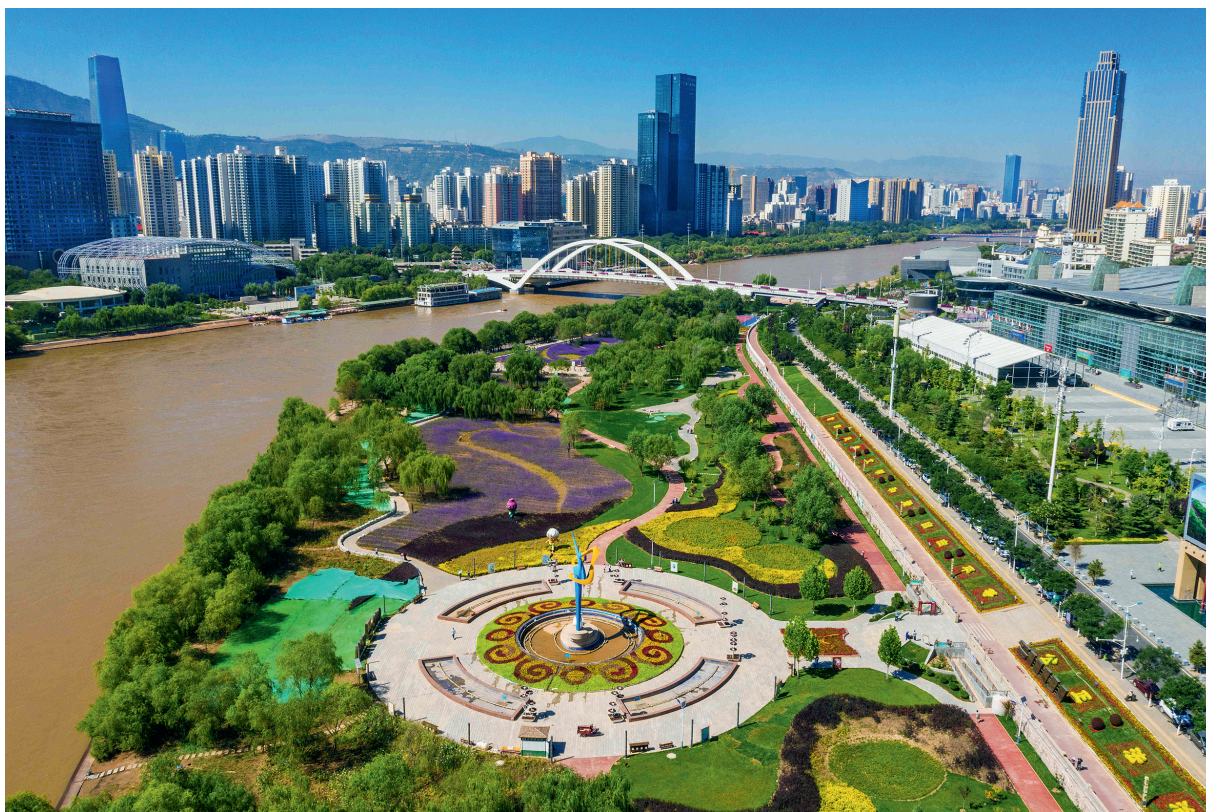
黄河之滨也很美