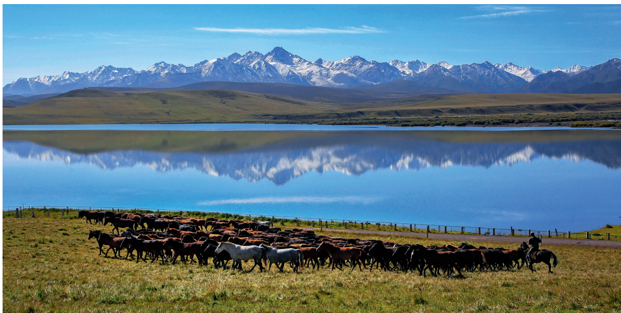
牧马祁连山