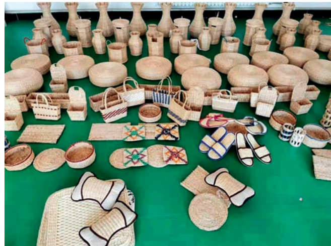
哈里哈乡村民的草编作品琳琅满目