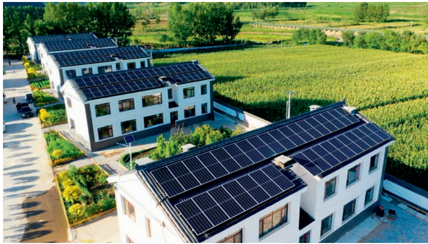
建在哈里哈村易地搬迁小区屋顶的光伏发电站

2019年年底,生态环境部宣传教育中心援助建设哈里哈乡哈里哈村易地搬迁小区屋顶光伏电站。截至2021年11月底,该光伏电站已运转发电14万度,获得发电收入7.1万余元,解决了搬迁小区日常用电、冬季供暖和物业费支出等。