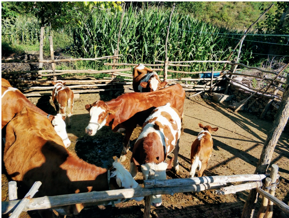
2020年,生态环境部宣传教育中心出资为哈里哈乡扣花营村购买了13头基础母牛,目前已有9头母牛产下牛犊,有力帮扶了村集体经济的发展