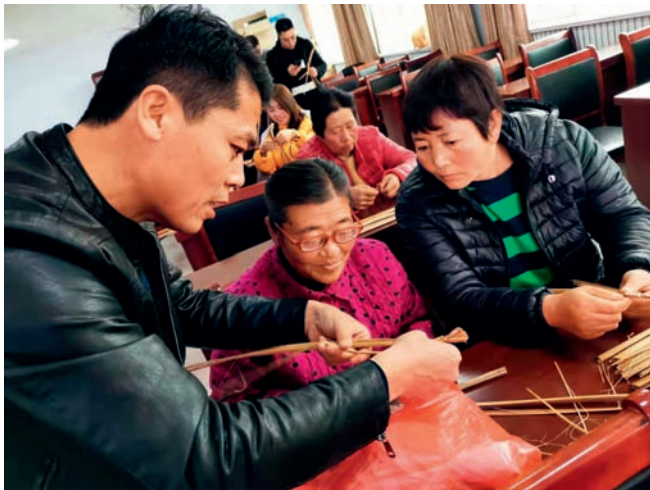
草编专家手把手传授哈里哈乡的村民编织技艺

2019年年底,生态环境部宣传教育中心援助建设哈里哈乡哈里哈村易地搬迁小区屋顶光伏电站。截至2021年11月底,该光伏电站已运转发电14万度,获得发电收入7.1万余元,解决了搬迁小区日常用电、冬季供暖和物业费支出等。