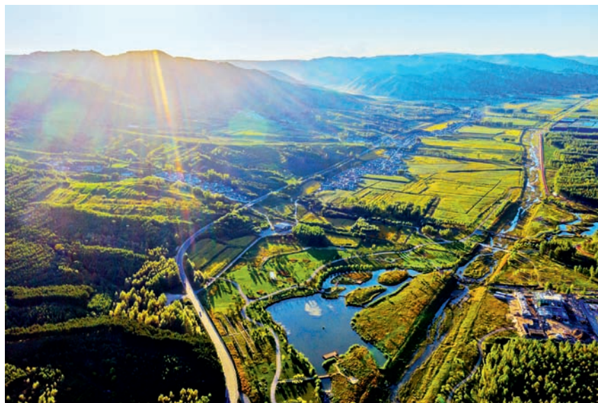
绿水青山中的承德哈里哈村俯瞰