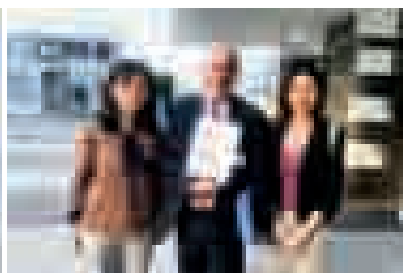
2019年9月22日，CCAN代表向联合国秘书长顾问委员会成员、经济合作与发展组织(OECD)秘书长安赫尔·古里亚先生递交CCAN就气候变化问题致峰会政策建议函后合影