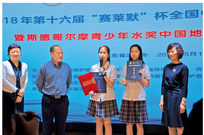
特等奖获得者现场感言