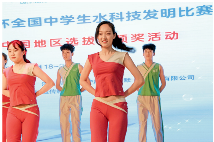
颁奖活动中,中学生的舞蹈活力四射

今年8月,活动主办单位环保部宣教中心将带领高中组特等奖项目团队出征斯德哥尔摩青少年水奖瑞典总决赛,向世界展示中国青少年水资源保护的科技创新水平。世