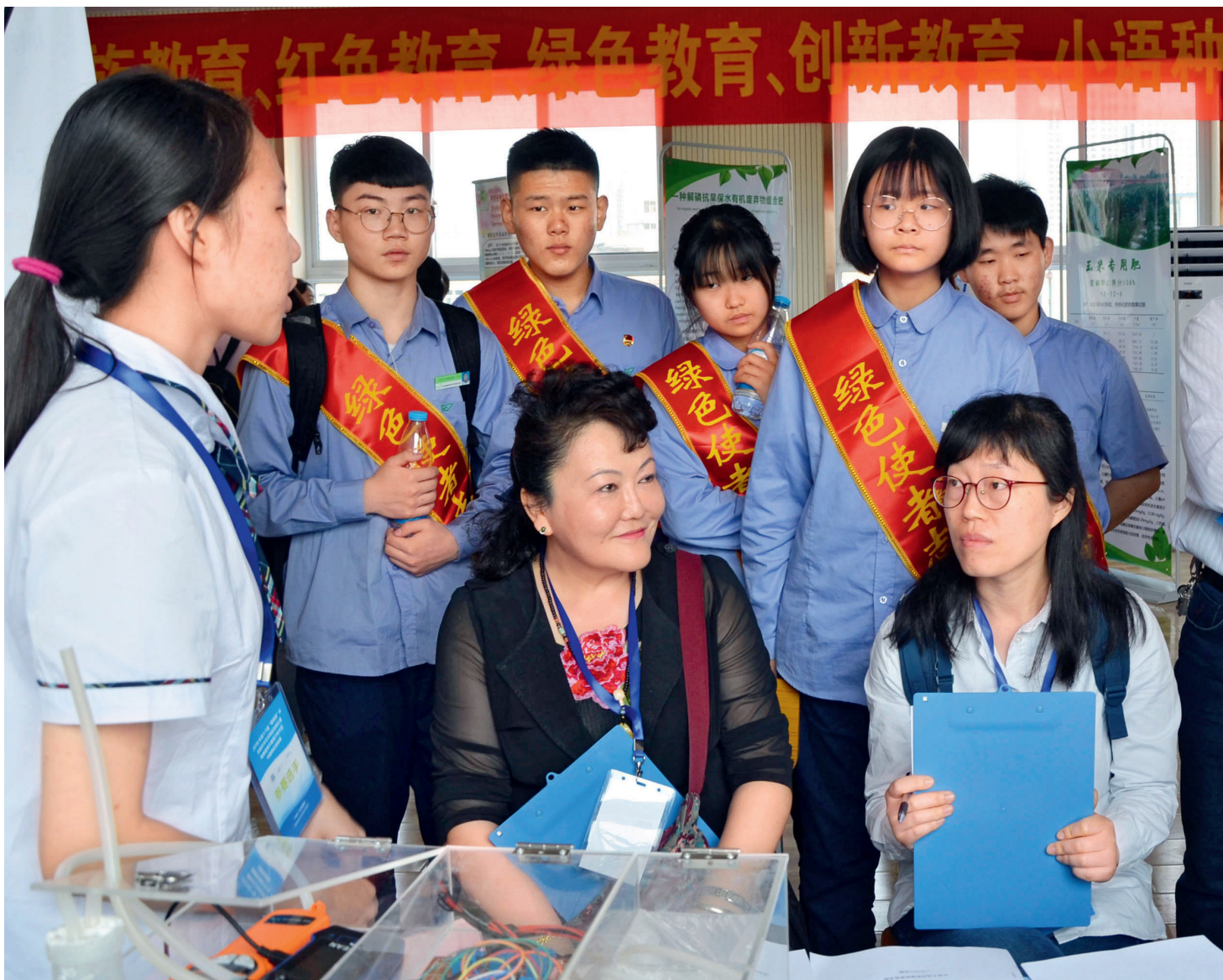
参赛学生接受评委问询