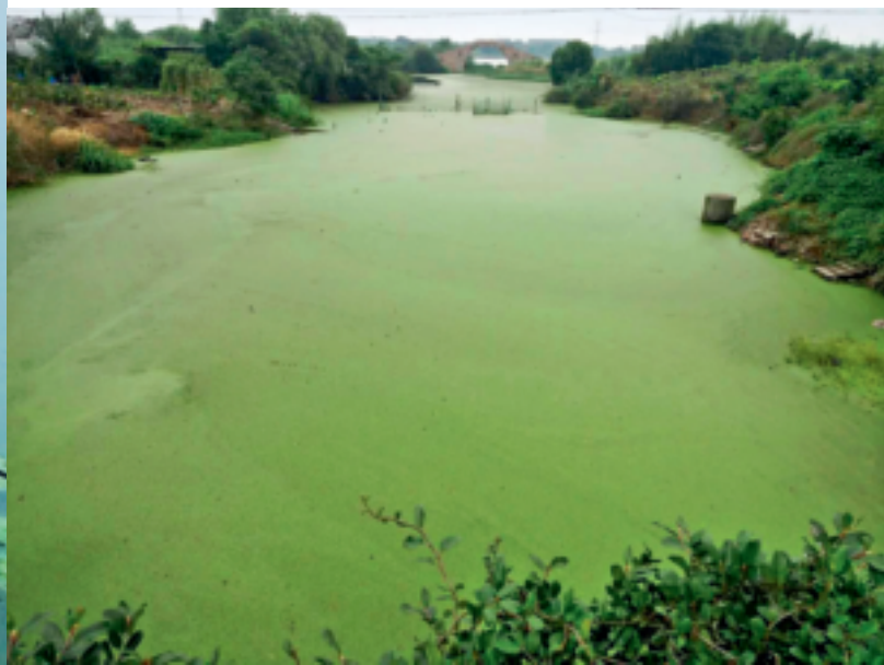
曾经的湖州市德清县刘家桥港,富营养化严重