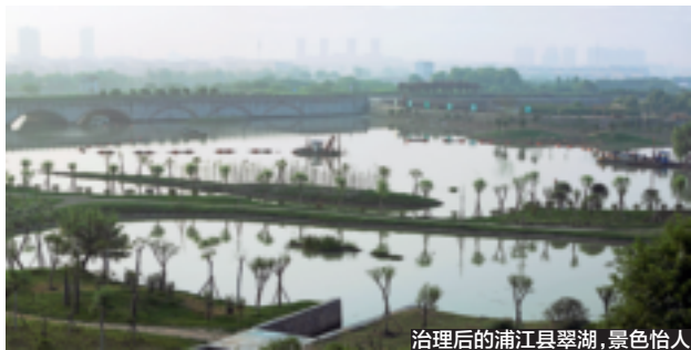
治理后的浦江县翠湖,景色怡人