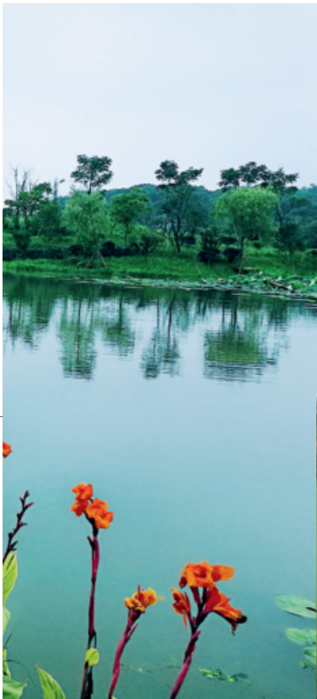
现在的湖州市德清县刘家桥港,水清景美