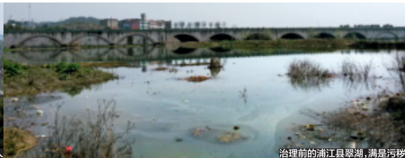
治理前的浦江县翠湖,满是污秽